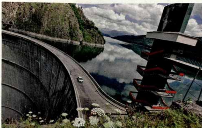
Hidroelectrica a garantat mai multe credite cu contractele cu „băieții deștepți”

AMENZI Clienții privilegiați ai Hidroelectrica pot fi nevoiți să ramburseze statului dublul prejudiciului